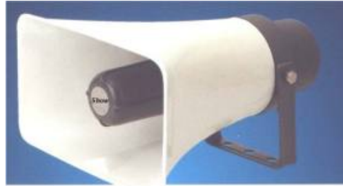
SC 30 AH / 30W 100V WATER PROOF HORN